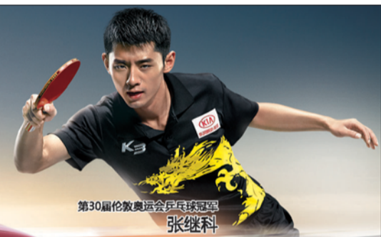
第30届伦敦奥运会乒乓球冠军 张继科