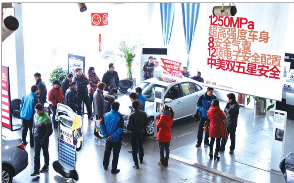
► 岁末车市迎来购车潮。

本报济宁12月24日讯(记者 马辉) 临近岁末,车市也逐渐热闹起来。进入12月以来,济宁车商的疯狂冲量和大力度促销,使得看车到店率和购车成交量激增。而到了12月下旬,这种态势则开始分流,一边是美系、德系的完美收官,一边是日系车的疯狂冲量,真是几家欢喜几家愁。