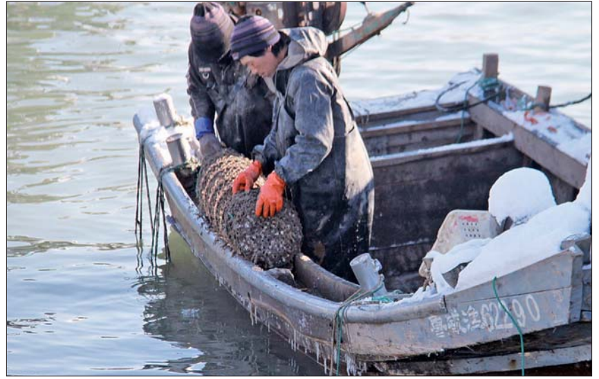
▲渔民站在脚踝深的积水中,用起吊机把扇贝笼收上岸