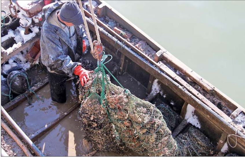
▲渔民在港湾内收扇贝,船帮和缆绳上都结上了冰挂