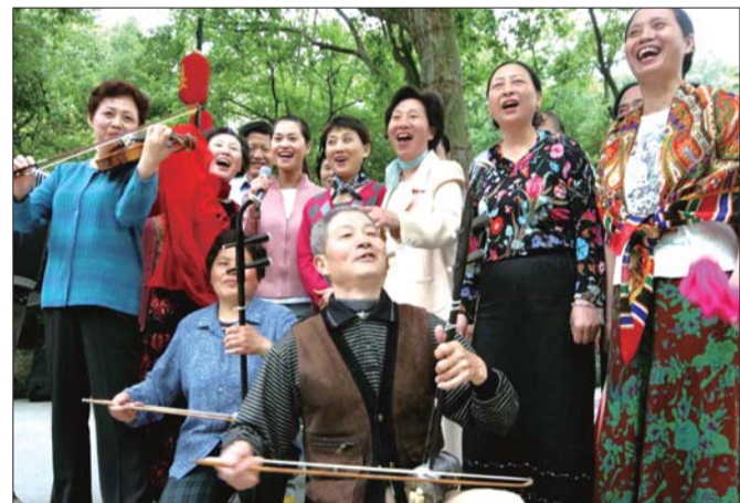
体彩公益金用于补充全国社会保障基金,促进社会保障事业发展。

发行费用中,各销售网点的佣金大约占到了总额的一半,其余则分配给各级体彩机构使用。相比之下,国外彩票发行的体制与我国存