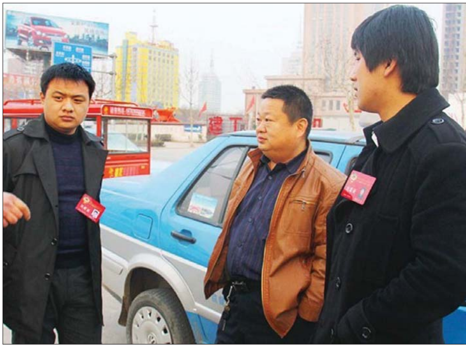
2012年两会期间,本报邀请政协委员利用休息时间走访调查黑出租情况。(资料片)

通知:中国工商银行聊城分行开展的牡丹交通卡专项促销优惠活动截止时间截止到2012年12月31日,已办理牡丹交通卡的用户请尽快领取免费的车载电子标签。