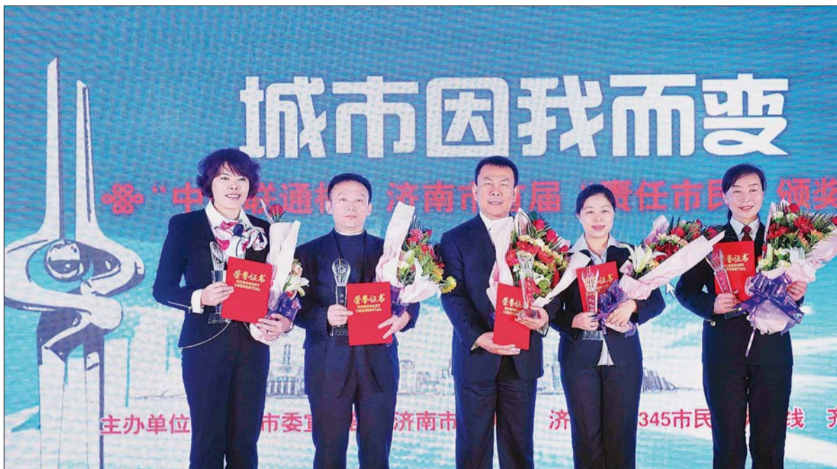
首届“责任市民”评选中五位获得最佳服务奖的市民。