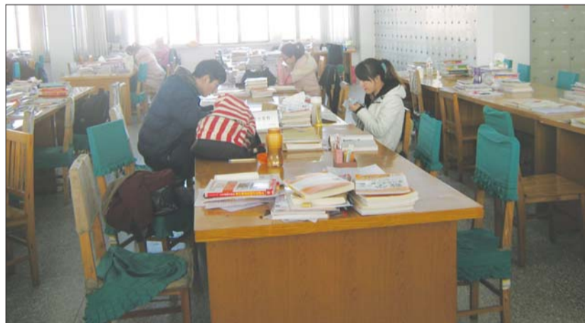
许多考生吃完饭就去自习室复习。

像小殷这样考前大补的考生不在少数。“最近急诊室时常收治腹泻、呕吐的考生,大多数是因为吃了过量的营养物质,胃肠受了刺激。”毓璜顶医院急诊门诊主管护师孙贤妮建议,食谱最好不要大“变脸”,正常饮食最重要。