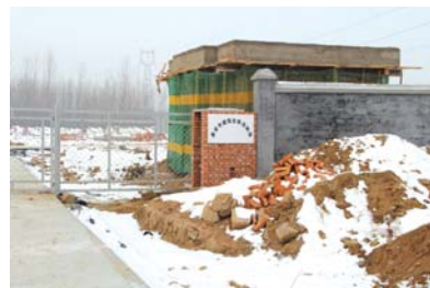
建造中的建筑垃圾处置场。

12月22日,随着第一车建筑垃圾进场,标志着该场已经正式启用。同时,加强建筑垃圾监管的一系列措施和《建筑垃圾管理办法》即将出台,城区建筑垃圾将实现统一监管,统一处置,重点查处乱拉乱倒、私设处置场地、随意抛洒等行为,为开展泰安市建筑垃圾统一无害化处理、资源化利用打下了坚实的基础。