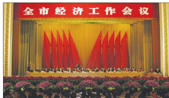
往年全市经济工作会议召开时,会场都摆放了鲜花。(资料片)

据了解,本次会议的议程共有两项,市委书记张江汀首先分析了当前经济形势,提出了明年经济工作的思路、目标和任务,随后市长王良对明年全市经济工作进行了具体安排部署。两项议程完成后,会议结束。