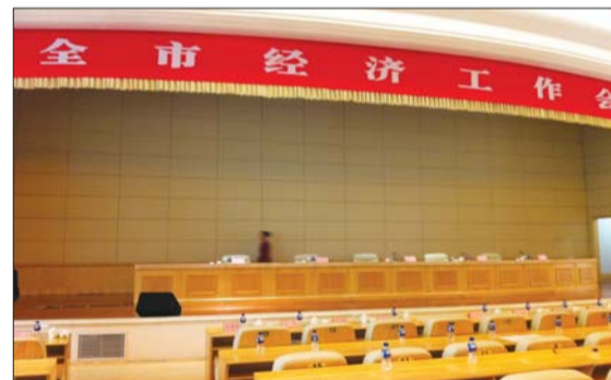
28日,一名工作人员从主席台走过,会场没有布置鲜花。