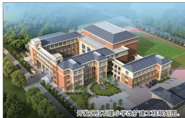
开发区红石崖小学改扩建工程规划图。

生提供更好的教学环境和设施。新的综合教学楼建好后,建筑面积将大大增加,届时可容纳18个班额的招生规模。“目前,在开发区红石崖片区,还没有一所高水平建设的小学,学校改扩建工程完工后,将大大改善办学条件。”刘耀堂说。学校改扩建工程规划图已基本确定,目前正在做施工的前期准备,改扩建工程动工在即,预计明年完工。