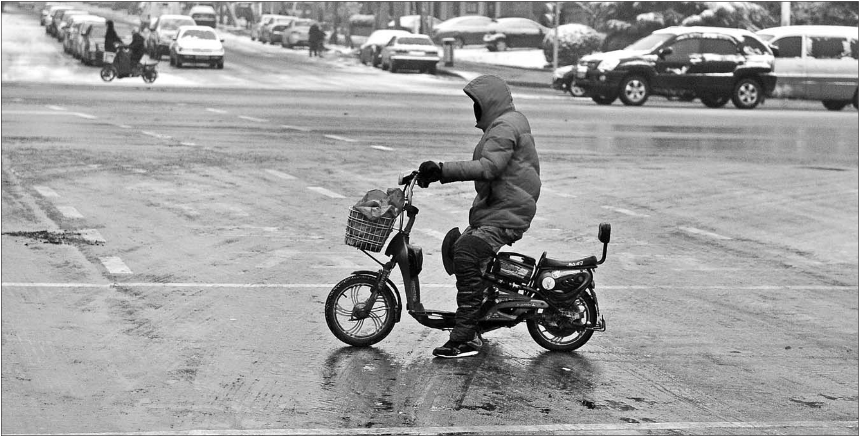
市民行驶在冰路上。