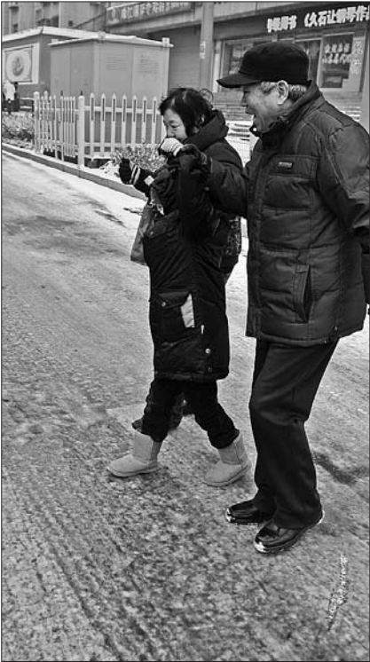
济南市文化东路上,小心翼翼走路的市民。

“城市管理部门已经撒了融雪剂,快车道依然成了冰路,那是否应采取更好的法子呢?”市民曹先生说。