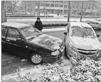
29日上午8点多,历山路南段,两车撞了。

由于路面结冰,很多车辆停车后起步打滑,不能行驶,交警在这些路段专门组织警力推车。