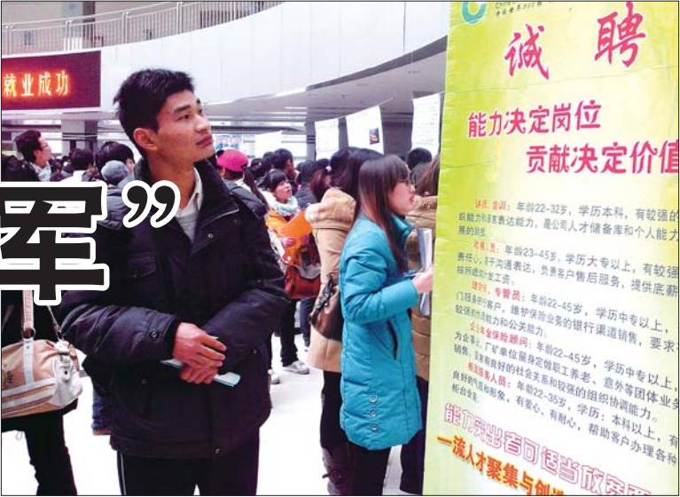
求职者正在查看招聘海报。

福利待遇、良好的企业文化等等都是管理方案中重要内容。“只有这样,才能提高企业员工的凝聚力和向心力,招到合适的人才并把他们留住。”