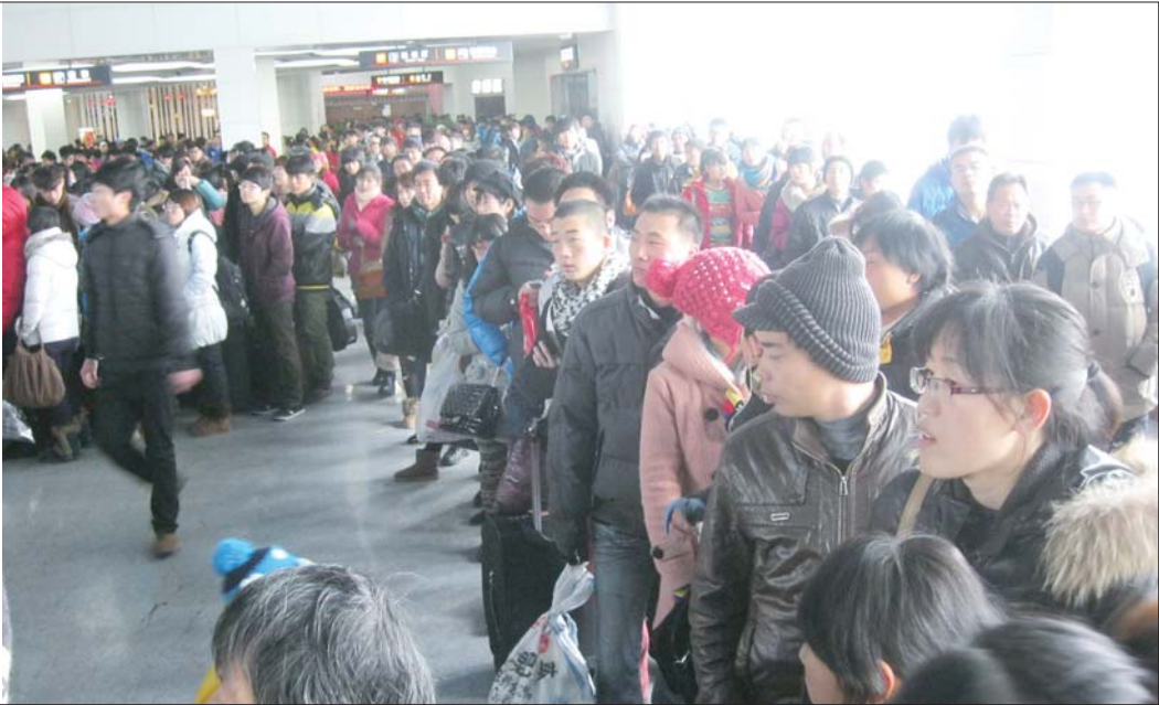
受降雪影响,汽车总站排起长队。记者 柳斌 摄