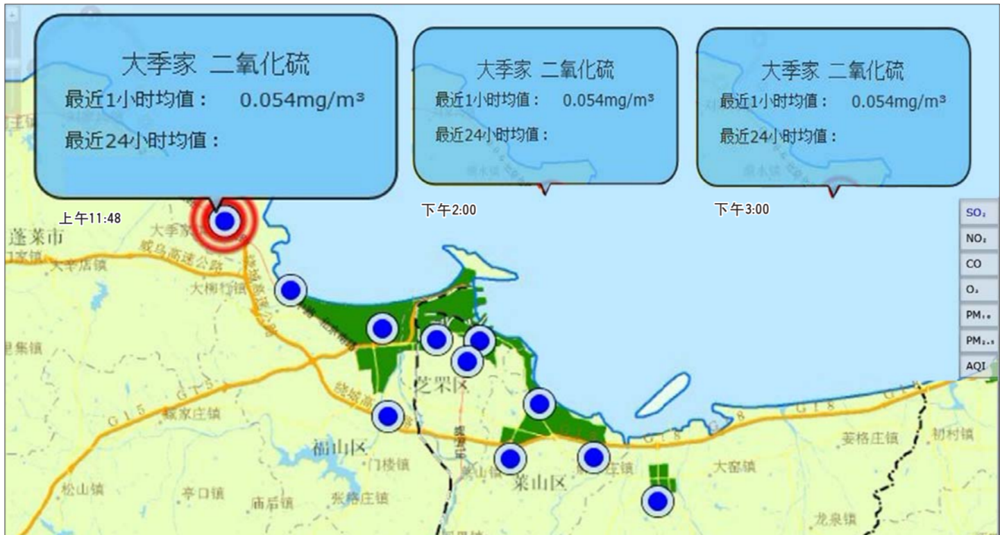
大季家监测点在三个时间段监测到的二氧化硫数据也完全相同。(网络截图)