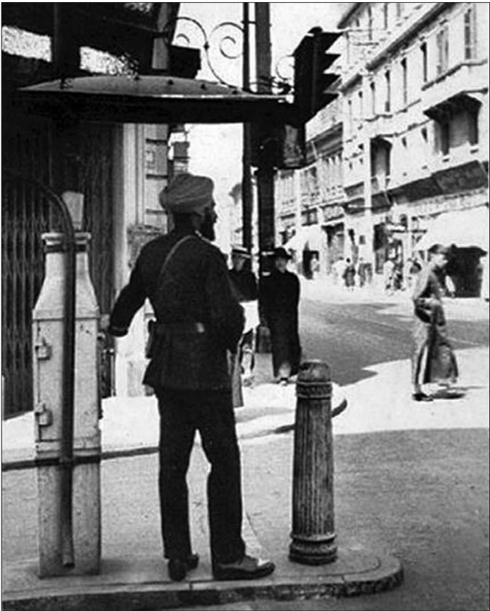
▲上世纪20年代,上海租界印度锡克族交警用手控制红绿交通信号灯。

说起红绿灯的起源,还要追溯到19世纪初的英国。那时,在英国的约克城,着红装的女人表示“已婚”,而着绿装的女人则是“未婚”。当时,伦敦议会大厦前经常发生马车轧人的事故。受红绿灯启发,英国机械师德·哈特于1868年设计了一种标志禁止某一种转向。转弯车辆都必须让合法地正在路口内行驶的车辆,过人行横道的行人更要优先通行。红灯是禁行信号,面对红