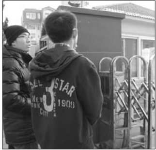
4日下午4点，不少考生来到电子学校考点看考场。

据悉，2013年的研究生入学考试被称为“史上最严”的一次研究生入学考试。考生不得携带手机等任何通讯工具进考场，否则属于违纪。根据2013年全国研究生考试管理办法规定，从今年开始，考生每个科目考试所在考场和位置不再固定。4日下午，记者在考点看到，考生的准考证上就出现不同的考场，有的考生还很不适应。对此，市招办相关负责人提醒，本次考试每位考生的考点不变，但每个科目所在考场会有变化。考生一定要严格按照本人准考证所注明的考场号进入考场，对号入座。