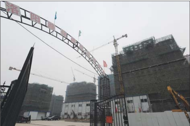
在洛阳路上,一处保障性住房项目正在进行施工。