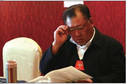
5日下午,在分组讨论会议上,一位政协委员认真地阅读材料。