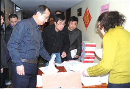
5日上午9时许,与会的人大代表陆续报到。