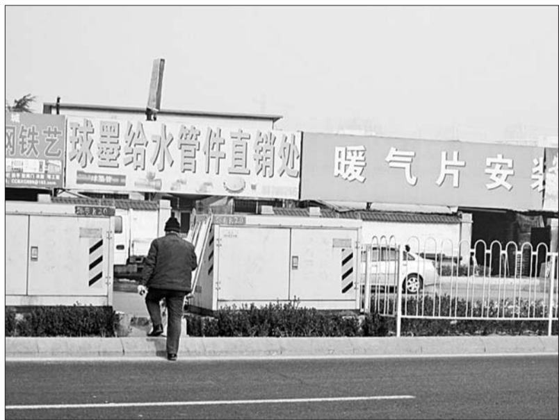
一行人正穿护栏缺口过马路,对旁边走地下通道的提醒视而不见。

此外,济南长途汽车总站也推出了提前20天预售春运客票的措施。1月7日起,旅客可直接到总站售票大厅及联网代售点提前20天购买到春运车票,也可通过24小时咨询订票电话96369提前10天订票,在任意售票窗口验证预留信息即可取票。为方便学生、农民工团体乘车返乡,汽车总站还推出了30人以上现场发车和团体包车业务,同时享受八五折优惠。