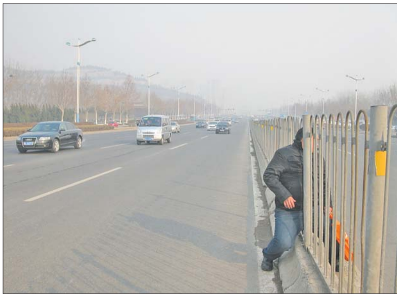
市民在经十东路钻护栏横过马路。

如此绕路,让不少市民选择钻中间护栏穿越马路。记者现场观察了10分钟,发现有十多名市民钻护栏过马路。继续沿经十