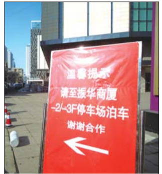
振华商厦外竖了显眼的指示牌。