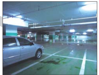
6日,振华商厦地下停车场负二层只零星停了几辆车。