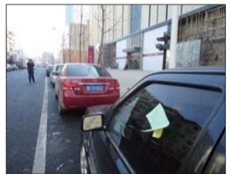
6日,停在西大街的私家车被贴了罚单。