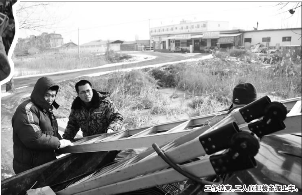
工作结束,工人们把装备搬上车。