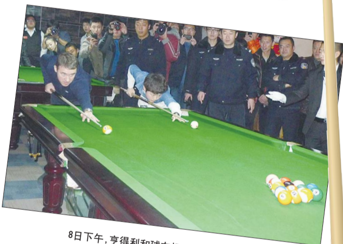
8日下午，亨得利和球迷切磋互动。

下午2点半，午休结束后的亨得利再次来到成功路桌球俱乐部，与这里的球迷进行了切磋互动，并获赠了烟台市台球俱乐部为自己准备的肖像画。