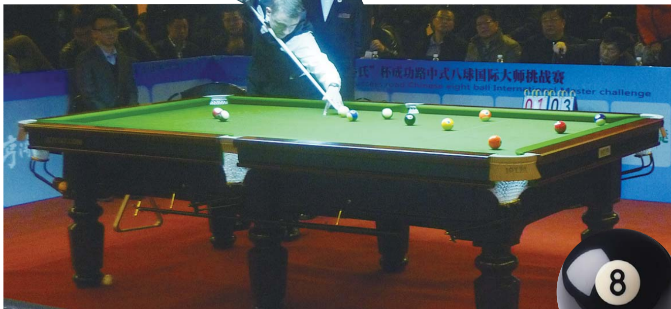
8日晚，亨得利在专心致志地比赛。