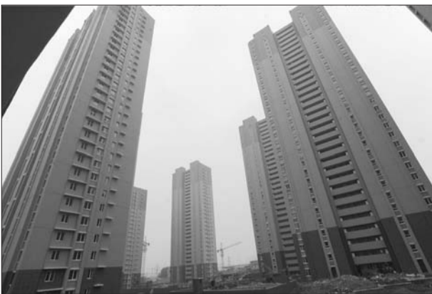
原四方区已经建成的保障性住房项目。本报记者 张晓鹏 摄

加强城市风貌和文化遗产保护,编制青岛历史建筑群和即墨古城遗址保护规划,加快国家水下文化遗产保护青岛基地建设,建设青岛山炮台一战遗址公园,推进千万平米文化产业园建设,培育国际动漫产业园、建筑创意产业园等十个重点文化创意产业园,引进高端文化创意产业项目,力争国家级数字出版基地落户。