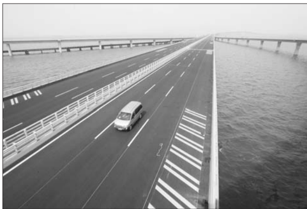
三城联动,交通体系建设快马加鞭。(资料片)