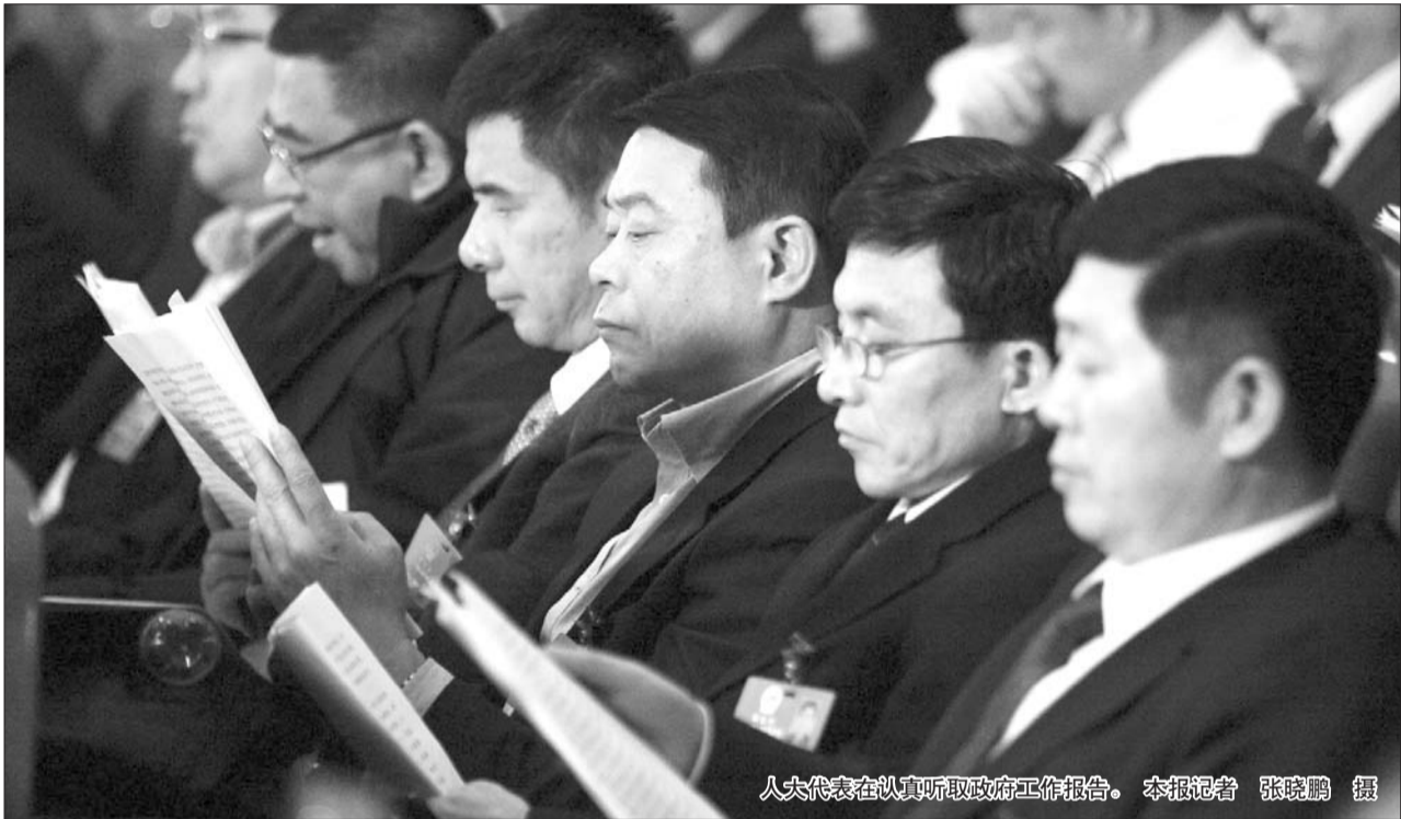
人大代表在认真听取政府工作报告。