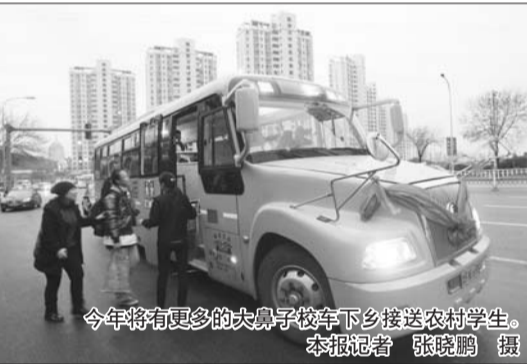
今年将有更多的大牌号校车下乡接送农村学生。

继续推进职业教育改革试点,建设10个高职特色专业群,培育现代制造业等3个示范性职教集团,积极支持民办教育,加强与高校的合作共建,推进在青普通高校重点学科市校共建工作。积极引进国内外优质教育资源,支持农村教育和特殊教育发展,推动新市民子女平等接受教育,全面推进素质教育,加强教师队伍建设和提高学生身心健康水平。