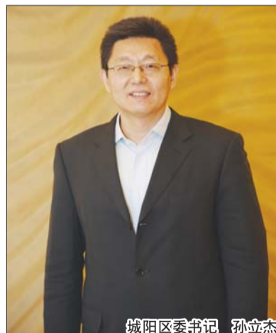
城阳区委书记 孙立杰