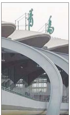
城阳经济社会发展又上新台阶。