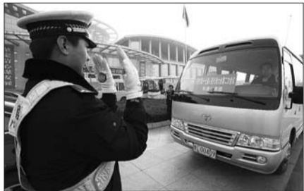
8日,交警在会场外指挥车辆停放。