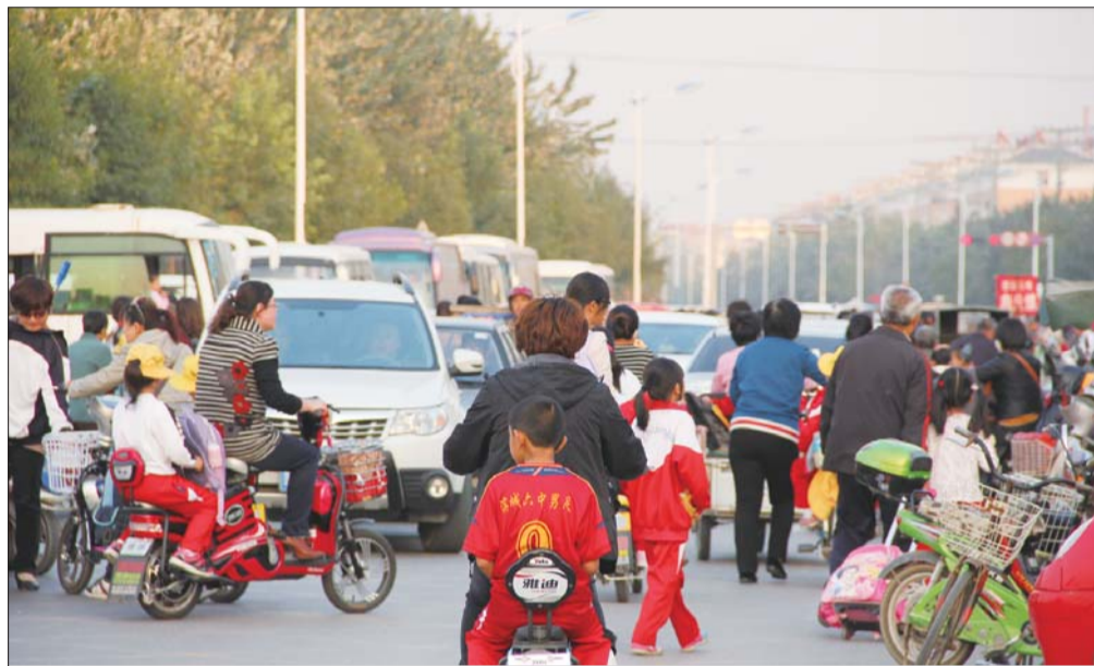
清怡中学门口,每到上放学的时候道路都非常拥挤,让大家非常头疼。

少年自护学校等多种形式的活动。树立从我做起,为交通环境做贡献的意识,营造人人遵守交通法规,人人维护交通秩序的氛围,使遵守交通法规成为广大中小學生自觉行为。