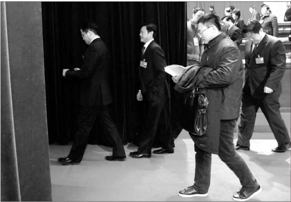
▲委员们结束了3天的议程,离开会场。