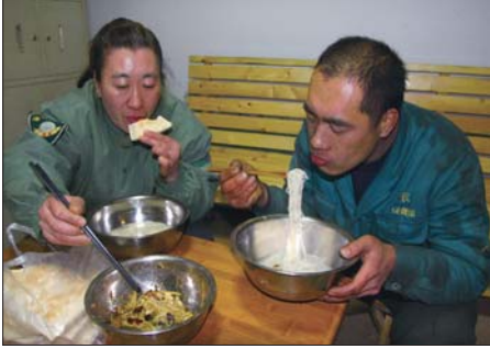
▲夜间值班工作人员的夜宵十分简单。