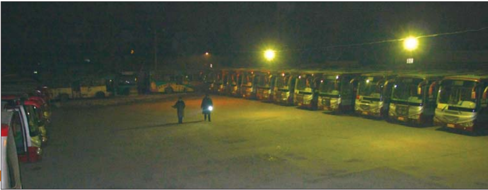
▲6日晚上10时左右，公交公司的工作人员在停车场巡视。

时针指向晚上7时50分，淄博公交121线路21辆客运车的最后一班完成全天营运任务驶进了终点站。这并不意味着驾驶员们劳累了一天的工作结束了，他们还要进行车辆例检、加气、打扫卫生等工作，这一系列的后续工作是很多市民所不了解的。近日，本报记者探访了寒夜里仍忙碌的公交人。