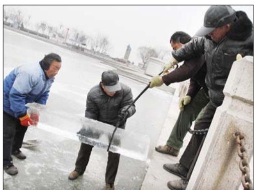
▲工人把冰锯成条状,从湖里捞上来。

按照聊城市的安排,聊城市住建委、文广新局、市政管理局、旅游局、水城集团和聊城大学将在东昌湖景区湖滨公园内分区划片制作冰雕,打造冬季旅游新亮点,活跃市民冬季休闲文化生活。