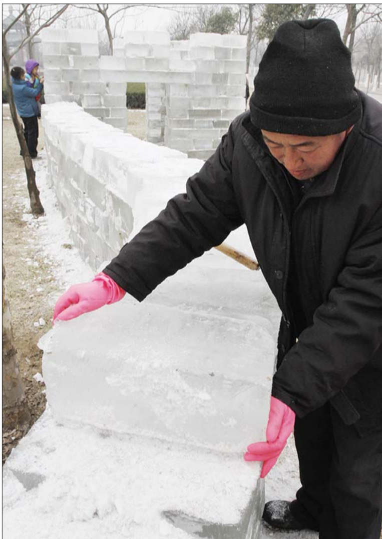
▶冰块被运到附近的工地上,用来制作古城楼等冰雕。