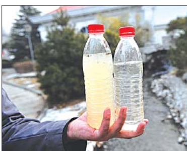
▲处理前后的水质“泾渭分明”。

地上的小广场里,一条小溪正流出水,工作人员介绍这就是处理后的水。记者用手捧起水,干净清澈,也没有任何味