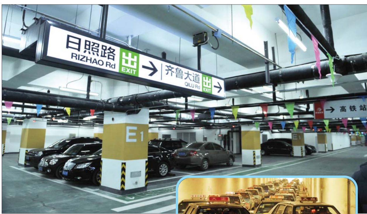
西站东广场地下停车场已经建好,但由于标识不明显,知道的人少,利用率不高。