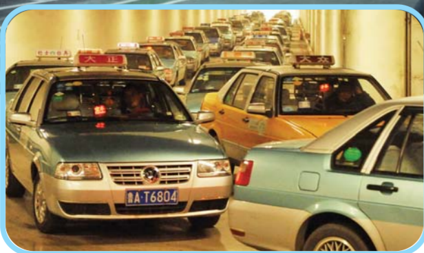
出租车在西站排起长队等客。