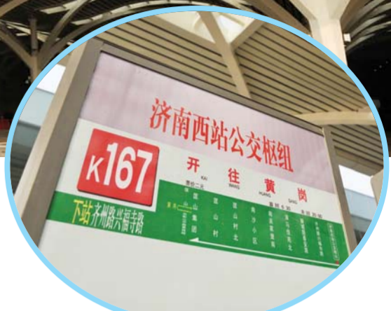
▲公交枢纽开始运行,但目前只有一条线路,显得冷冷清清。

来枢纽乘车,没想到只有一条线路,而且没有去市区的,白跑了一趟,“不能多开通几条线路?”据了解,目前K167全天有8趟车在运行,平均一小时有三