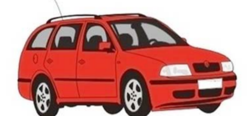
自驾车用时45分钟花费15元