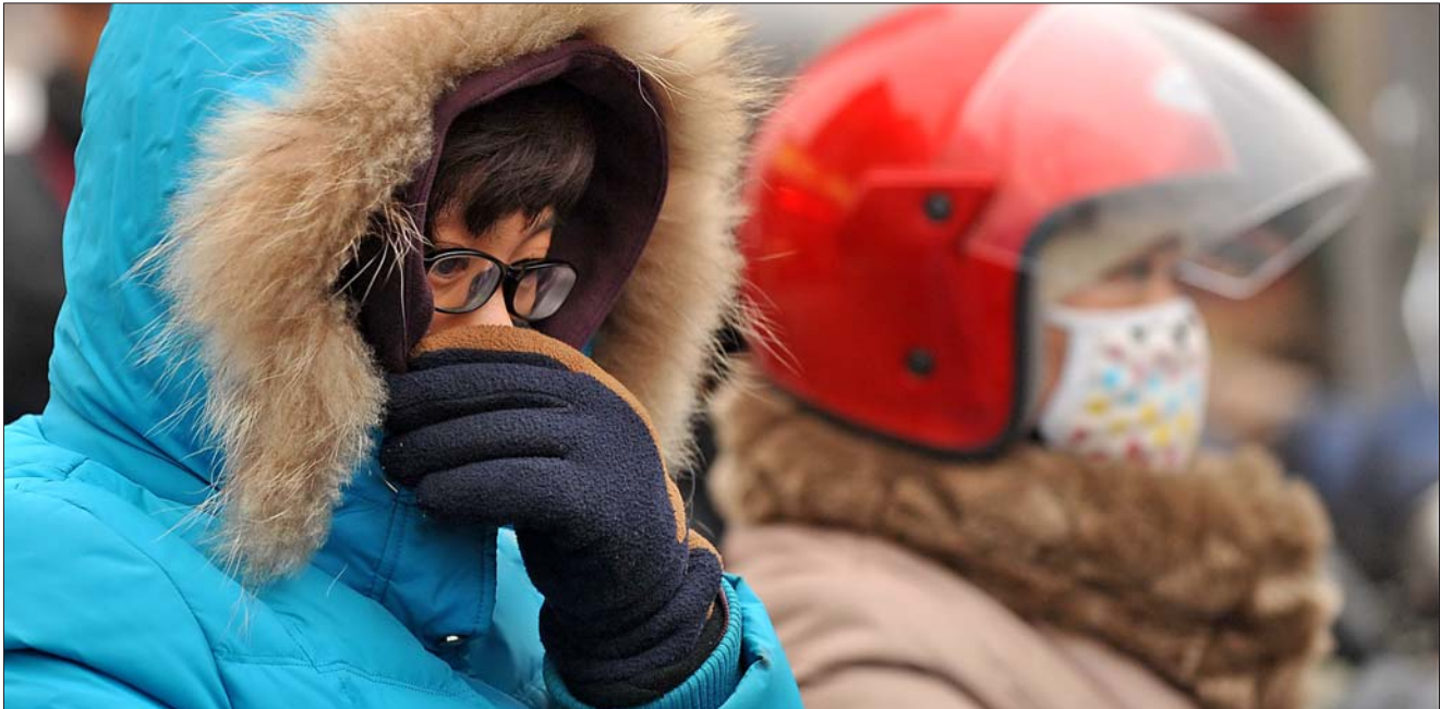
1月14日,济南街头,众多行人戴口罩行走。