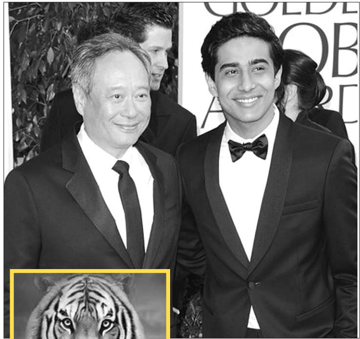
▲李安携《少年派》主演现身。

我一直以为,中国导演最有可能斩获奥斯卡的应是冯小刚,因为他拍电影的态度至少是真诚的。今年元旦档期,李安的《少年派》和冯小刚的《一九四二》同期上映,《少年派》并没有过多的宣传,我一开始甚至以为这是一部儿童动画片,与此形成鲜明对比的是冯小刚的《一九四二》,从开拍之初就炒热,当宣传势头催生的热乎