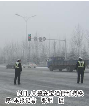
14日,交警在宝通街维持秩序。

“这个地方算是潍坊城区最陡的坡了,早就应该想想办法,不能再这样了。”周边居民说。