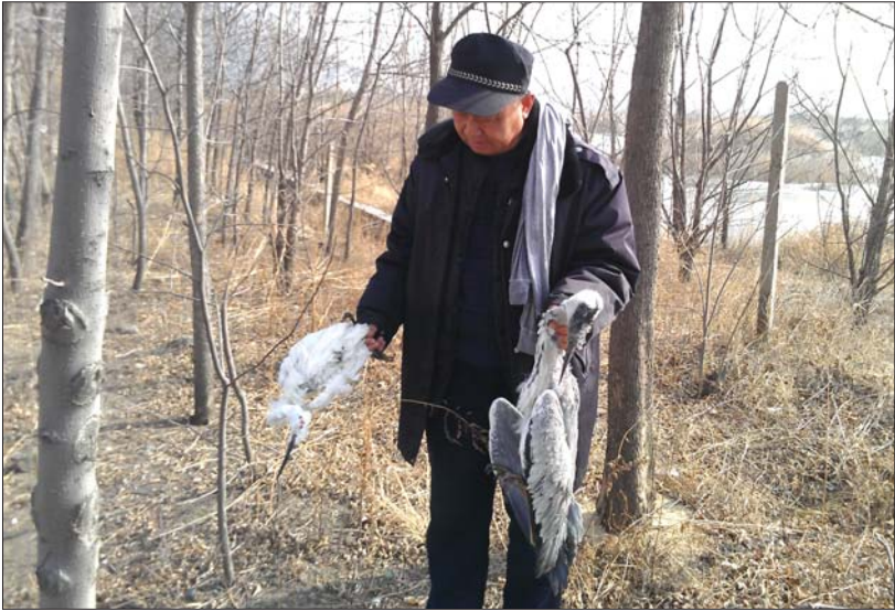
张先生的同事找到一只死亡的苍鹭。

崂山大河东湿地栖息着160多种鸟类,近日,湿地内却相继有7只苍鹭离奇死亡,附近发现了12个敌敌畏瓶。崂山林业部门巡查后暂未发现敌敌畏瓶,称会持续关注此事。