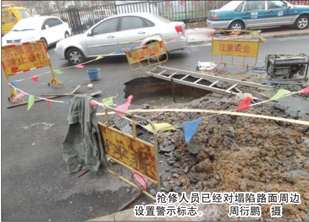
抢修人员已经对塌陷路面周边设置警示标志。

在现场,市政部门的工作人员一边利用警示牌请车辆绕道行驶,一边对塌陷部位进行详细的勘察。一位工作人员称,从现场观察以及市民目击的情况看,塌陷的坑洞位置正是自来水管道的所在地,可能管道接头出现了漏水现象,道路下的泥沙经过长期冲刷,导致路面下方形成一个空洞,一旦受到的