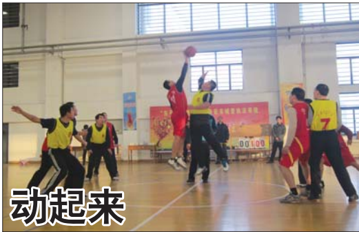
动起来 12日上午,泰安市城管执法系统举行篮球比赛。

称王先生在他们手上,汇钱就放人。梅女士给对方账号汇去600元钱。对方还想继续要5000元,梅女士报了警。 岱宗坊派出所民警让梅女士先停止汇款,把她带回所里调查情况。民警想办法和王先生取得了联系,王先生已经回到家里,没有遇到异常情况,避免梅女士进一步损失钱财。原来梅女士收到的是普通汇款诈骗短信,刚好和联系不上丈夫赶到一起,误以为丈夫被绑架。 民警提醒遇到类似情况先报警求助,警方会落实,不要轻信汇款短信。