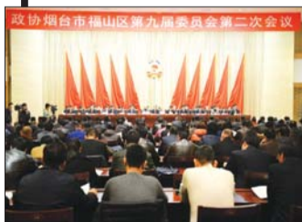
福山区第十七届人民代表大会第二次会议现场。

重点抓好哈山卢寺宗教文化区、蓝湾旅游度假区、双龙湾童心世界游乐区等项目建设。打造从回里樱桃采摘起步,涵盖哈山卢寺、双龙潭等特色项目于一体的整条旅游线路。年内,青龙山美食街投入运营,夹河岛综合开发项目争取开工,门楼水上新城启动建设。