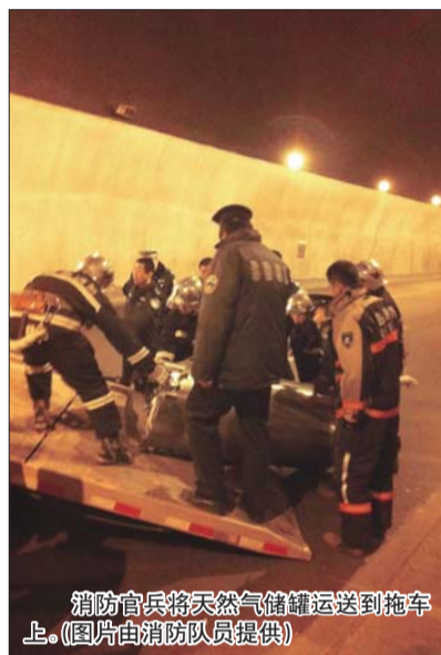
消防官兵将天然气储罐运送到拖车上。

放军401医院北院进行抢救。与此同时, 救援人员利用铺设水枪阵地对泄漏的天然气进行稀释, 并顺利关闭燃气罐阀门, 历时近半个小时时间, 最终消除了隐患, 将天然气储罐转移到安全地带。记者下午从医院了解到, 受伤的小货车司机主要是头部受伤, 目前没有生命危险, 目前正在医院接受治疗。