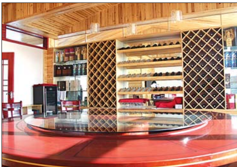
会所内部装修很豪华。