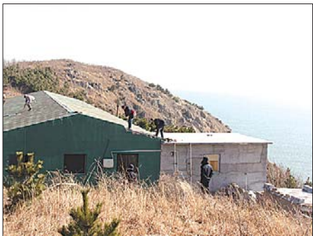
会所依山傍海,地理位置十分隐蔽。