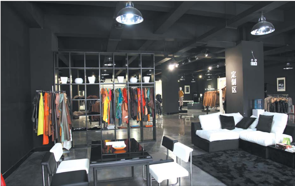
TOT皮衣“工厂店”内的定制区。

看着每个月的销售记录,曲学斌没有想到,在整个服装行业处于逆境的现状下,每个月的销售数据还会翻倍地增长。这使他更坚定了一句话:服装业确实需要探索新的模式和出路。 2012年10月份,做了十多年外贸生意的烟台宏源时装有限公司董事长曲学斌,在自己的工厂外开了一家“工厂店”,推出自己的皮衣品牌TOT。