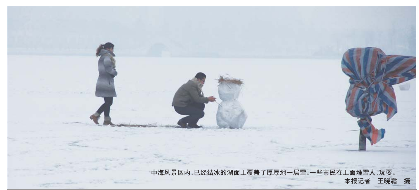
中海风景区内,已经结冰的湖面上覆盖了厚厚地一层雪。一些市民在上面堆雪人、玩耍。

本报1月20日讯(记者 张卫建 通讯员 王金瑞 刘滨) 从1月20日早上开始,滨州普降雨雪,记者从相关部门获悉,雨雪天气中滨州辖区内高速公路正常开启。 一场小雪天气给滨州辖区高速公路带来严重交通安全隐患,为做好冰雪天气条件下道路交通安全管理工作,保障道路安全畅通,滨州高速交警部门提前做好应急准备,及时启动《恶劣天气道路交通安全管理工作应急预案》,增派警力,加强信息提示,强化路面巡逻管控。截止1月20日16时45分,滨州辖区高速公路路面受到影响不大,通行秩序良好,辖区收费站没有封闭。