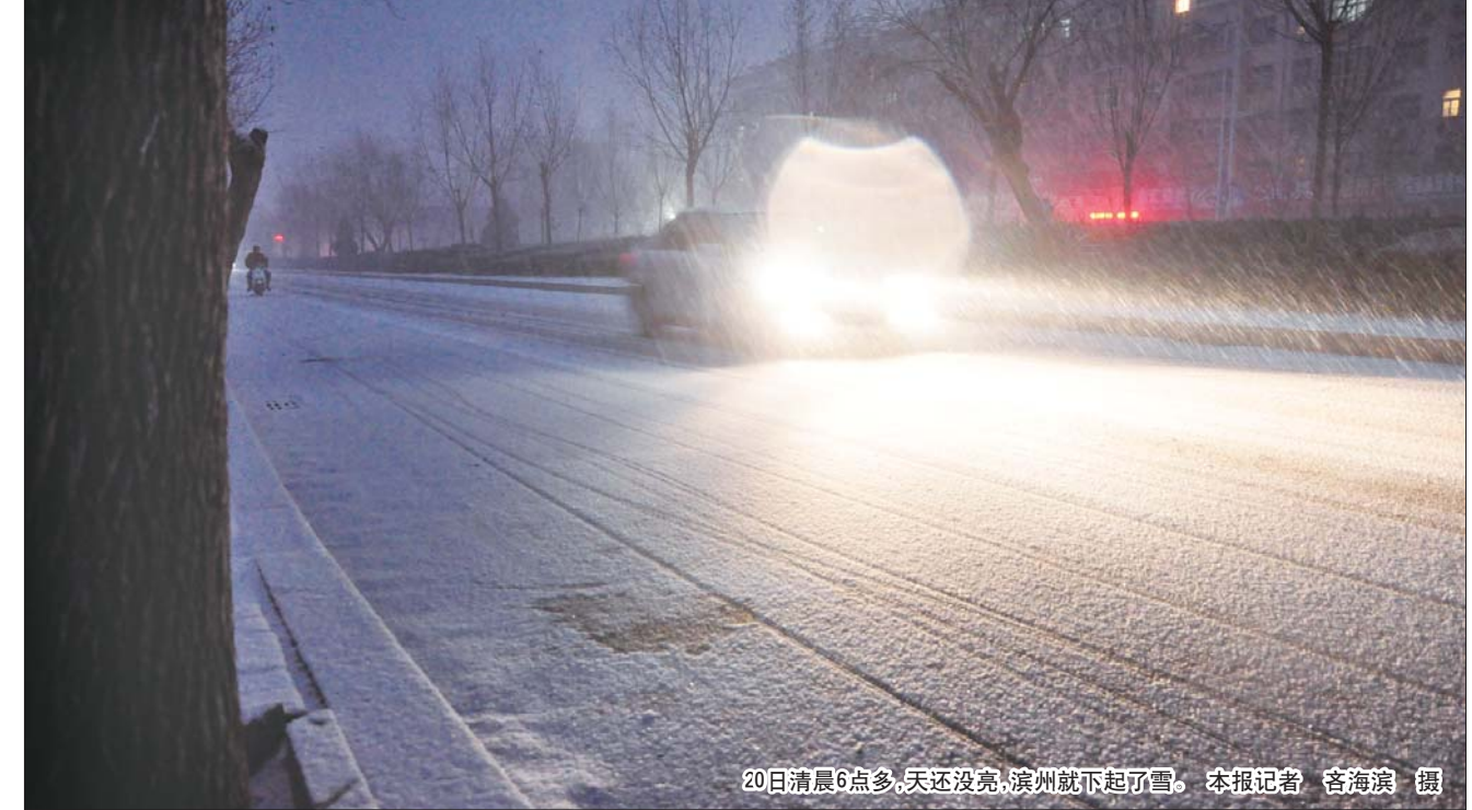
20日清晨6点多,天还没亮,滨州就下起了雪。

本报1月20日讯(记者 张卫建 通讯员 李明 王海亭) 1月20日清晨,滨州市区普降小雪。滨州市环卫部门及时启动冬季清除积雪应急预案,出动雪铲车6台、风扫机58台、综合除雪车1台、铲车2辆,环卫工人700余人,对市区主干道、学校、医院等重点区域进行除雪、疏通作业,确保了城市道路交通畅通。 1月20日下午,市区部分路段出现路面积水、人行道积雪较厚的现象。雪后气温下降后,结冰路滑,将影响市民和车辆安全出行。针对上述问题,滨州市城管执法局环卫处组织保洁队员操作58台风扫机,使用400把除雪铁锹,将人行道的积雪及时清理,防止行人摔倒;使用500把推板,及时将路边积水推到下水道算子里,防止雪后结冰。