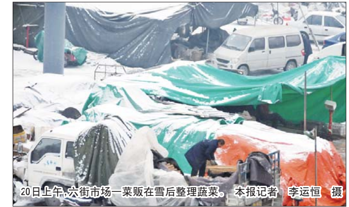
20日上午,六街市场一菜贩在雪后整理蔬菜。