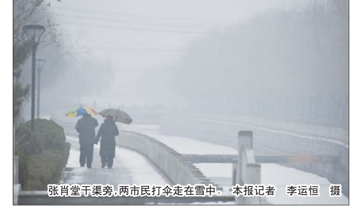
张肖堂干渠旁,两市民打伞走在雪中。