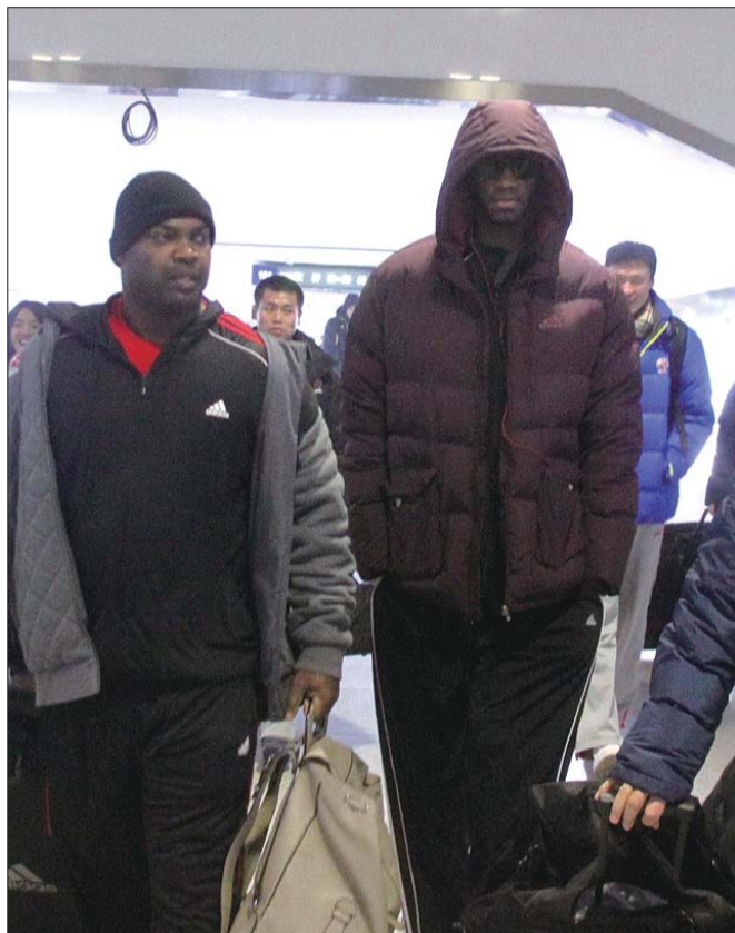
▲21日,麦蒂抵达济南,酷劲十足。

一边是为偶像欢呼,另一边是为主队呐喊,球迷该怎么做?贴吧里,部分泉城“麦蜜”为怎样加油伤起了脑筋,“现场的口号最好是既能给麦蒂加油,又能顾及山东队员的感受。”不过这样自相矛盾的问题,本身就挺让人纠结,这口号怎么喊,还是球场见吧。