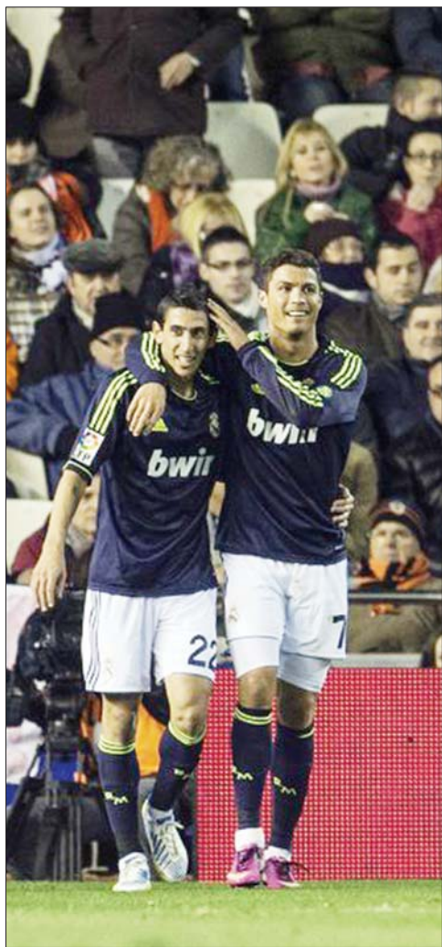
C罗(右)迪马利亚各入两球,皇马客场5:0大胜。

第9分钟,迪马利亚在突破至禁区左侧后无私横传,伊瓜因顺势将球送入网窝。随后C罗和迪马利亚两人开始了对对方防线的轮番攻击,在上半场结束前分别两度建功,比赛只打了半场就彻底失去悬念。