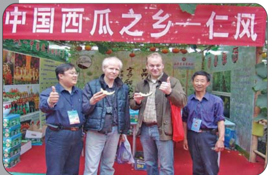
仁风富硒西瓜,吃了都说好。