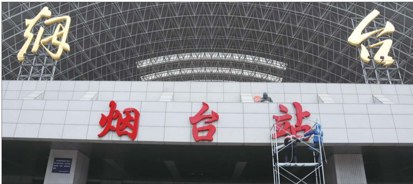
烟台火车站南口加上了“烟台站”三个大字。

据了解,在今年烟台市政协会议上,经济二组的政协委员们在小组讨论时曾就火车站名字展开热烈讨论,希望把“烟台”两字改为“烟台火车站”,让更多外地人知道火车站的准确位置,也能更好地展示烟台城市形象。