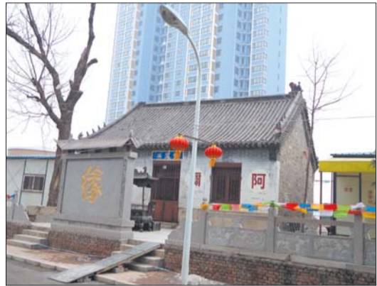
高楼大厦旁的三宝寺。