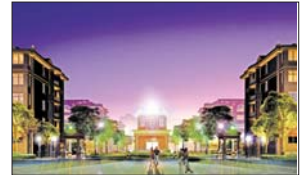
▲九龙明珠花园夜景效果图

件,合理完善各业态功能配置,对项目进行精准的市场定位以及产品定位,使项目的产品规划、功能布局、园林景观等方面上都达到了引领市场的高度。而九龙明珠花园,正是这方面的佼佼者。