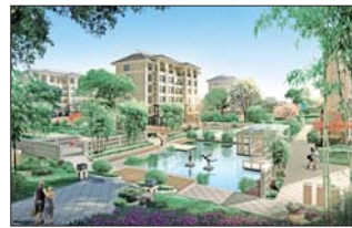
▲东骏阅山中心轴效果图