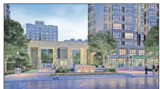
▲山花泰和府南入口效果图

2012年,威海楼市上空既弥漫着调控的阴云,又经历了保利、华润等国企大鳄的强烈冲击。大牌国企的纷纷介入,令威海的地产市场瞬间呈现僧多粥少的局面,竞争空前激烈。但所谓哪里有高富帅,哪里就有逆袭的屌丝,在这汹涌浪潮中,有一个企业却在惊涛拍岸中岿然不动,激起千堆雪。她就是山花。山花凭借本地良好的民众基础与口碑,在2012年取得不俗的业绩,1.2个亿的骄人销售业绩,近