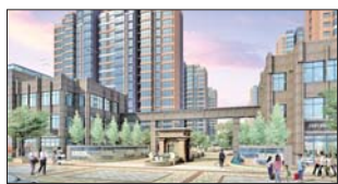
▲尚海湾主入口效果图

酒是陈年的香,历久弥新的尚海湾正如藏在深巷的酒香,飘万里又无影踪。在2012年,联行经过反复的产品定位、设计以及销售、宣传上的不尽思量,只力求将最好的作品奉献给世人。我们说,它应该是与众不同的,是深深扎根于威海的一项世界奇迹;我们又说,它应该是普罗大众的,它充满长峰市井的气息,是最具生活感悟的场景。2013年,它将揭开神秘的面纱,与联行一起,给威海一个惊喜。