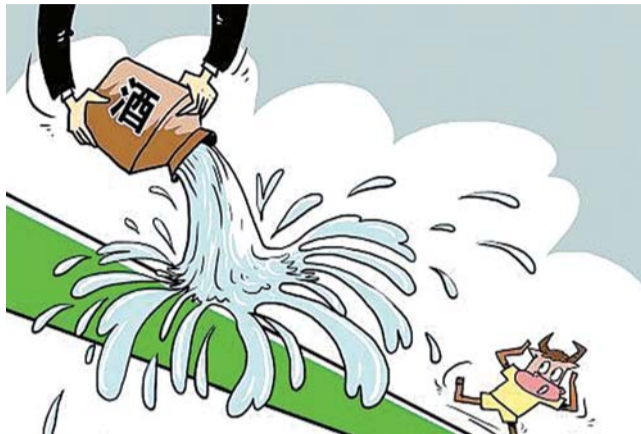
昨日跌幅前十名股票

当日股市,山西汾酒跌幅最惨,盘中一度接近跌停,并且数次跌破9%;贵州茅台小幅低开一路走低,收于178.5元。据证券网数据统计,贵州茅台一个月内跌幅高达15.92%,股价创下自2012年1月以来新低;而洋河股份大跌6.54%,收于80.39元,在本月上半月,洋河股份还曾在1月9日、11日、14日、15日突入百元股点,实实在在“逛了一圈就撤”。据证券网数据统计,洋河股份一个月内跌幅高达14.27%。