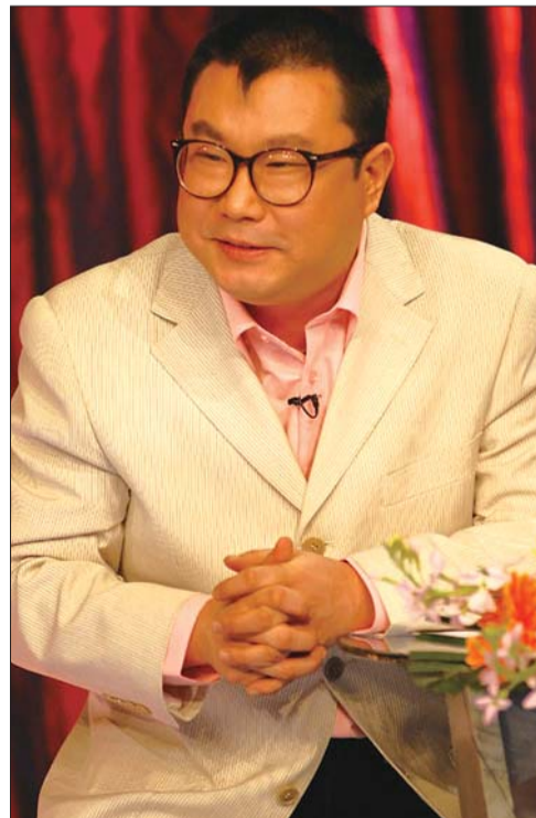
尹相杰最近一直忙于各大卫视的春晚。

“日照是中国优秀旅游城市，享有蓝天碧海金沙滩的美誉，在以后的演出中，我也会宣传日照，让更多的人来日照游玩。”尹相杰说。