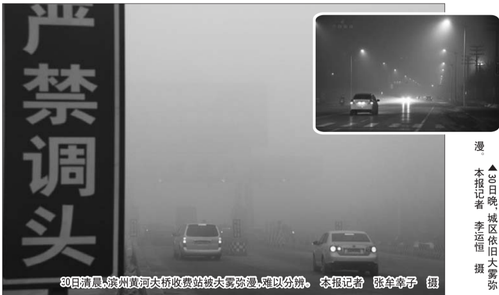
30日清晨,滨州黄河大桥收费站被大雾弥漫,难以分辨。

本报1月30日讯(记者 王晓霜) 从本周一开始至今,滨州市一直被雾霾笼罩,30日当天的雾较前一天更浓了一些,各县区能见度均较差,空气污染也较重。30日下午,滨州市气象台首次发布了霾黄色预警信号。受冷空气影响,滨州市31日将迎来一场降水过程,夜间冷空气来袭会逐渐驱散雾霾天气。 今年以来,滨州市连续遭遇大雾天气,尤其是自本周一以来,连续三天都被大雾弥漫。滨州市气象台从28日开始已经连续三天发布大雾黄色、橙色预警信号。30日当天,滨州各县区仍被雾霾笼罩,局部地区能见度不足200米。与前几